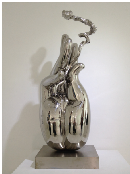
(上图)为获奖作品《指舞云韵》此不锈钢作品以佛手和升腾的云雾为基本形象，用自己的独特视角诠释了佛教文化和思想。