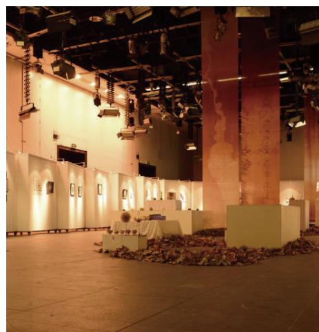
(图、文：学生工作部 学生与校友事务办)

11月20日下午3点，由院艺术协会主办的第二届“材料节”学生作品展于院A区多功能厅正式开幕。 本次展览延续上一届的主题“材料”，共展出来自染服、陶瓷、视传、工业、环艺、工业美术等系学生作品88件，作品覆盖从大一至大三的学生。以材料的视角重新审视艺术与设计，能够开辟从材料出发的创新之路。本次展览旨在促使同学们以审慎思辨的态度体会身边的材料；鼓励同学们探索以材料为媒介的更多可能性；促进不同专业，不同年级的同学们彼此交流，相互启发，抓住更多灵感，发挥更多创新。关于材料，我们可以手工为之，机械器之，电脑算之；没有做不到，只有想不到。且看我清美学子“爆料”之旅！