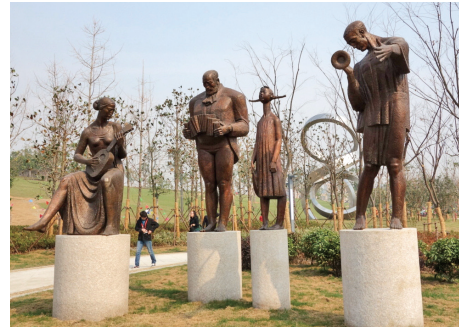
《呢喃的歌》（闫坤 银奖）