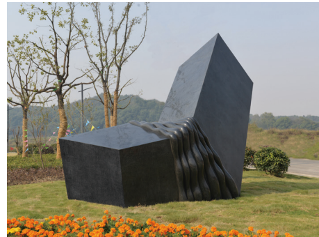
《高山流水》（陈辉 铜奖）